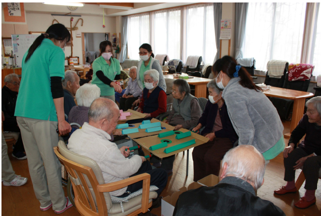
みんなで楽しくレクリエーション

あちらこちらに手作りの物が飾られ、段ボールで作られた絵馬には『ピースに元気に来られるように・・・』と書かれた絵馬が多く、ここで楽しく過ごされているのを垣間見ることが出来ました。