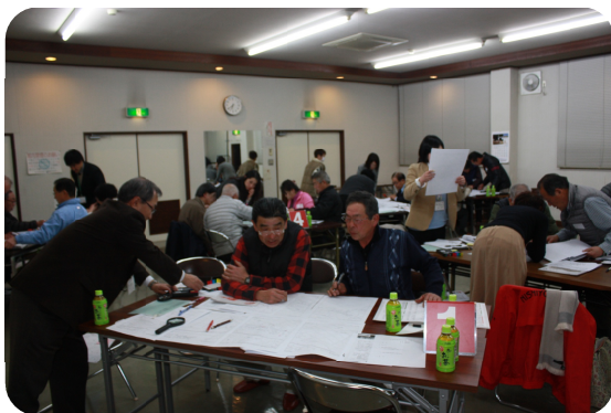
全体の会議の様子（西横野地区）