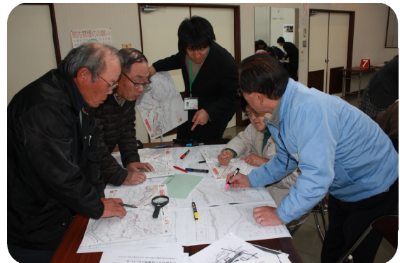
地図にマーキング