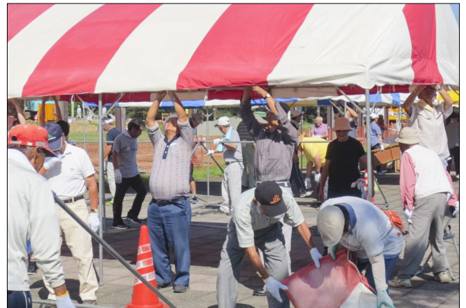
福祉ふれあいまつり前日準備の様子

【問い合わせ】 安中市ボランティアセンター 本所 住所：安中市安中3-19-27 TEL382-8397 支所 住所：安中市松井田町新堀245 TEL393-3948