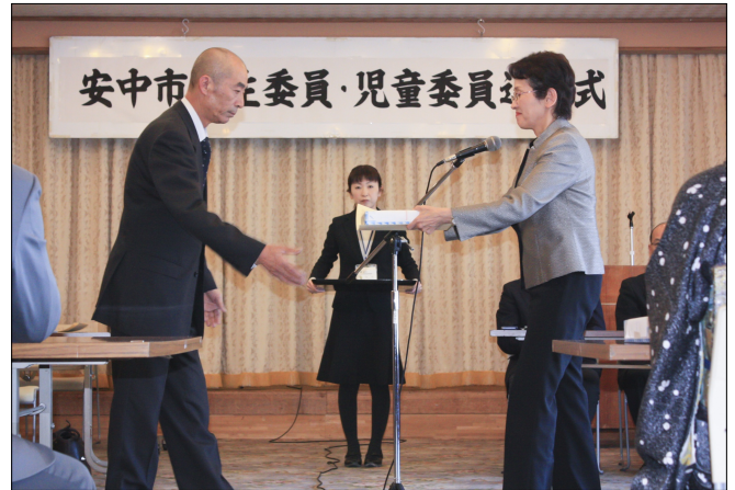
感謝状の伝達および記念品の贈呈

任期を終えた民生委員、児童委員にねぎらいの意を込め、1月29日（水）並木苑にて「安中市民生委員・児童委員退任式」が開催されました。