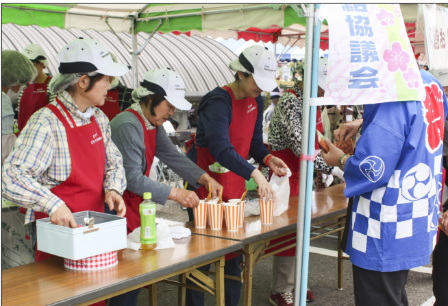
安政遠足前夜祭での出店の様子