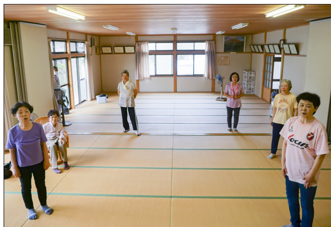
感染対策しながらの全員合唱の様子

コロナによる自粛の今日、週に1度の身体と頭のストレッチは沈みがちな気持ちを軽くしてくれるようです。（和田真）