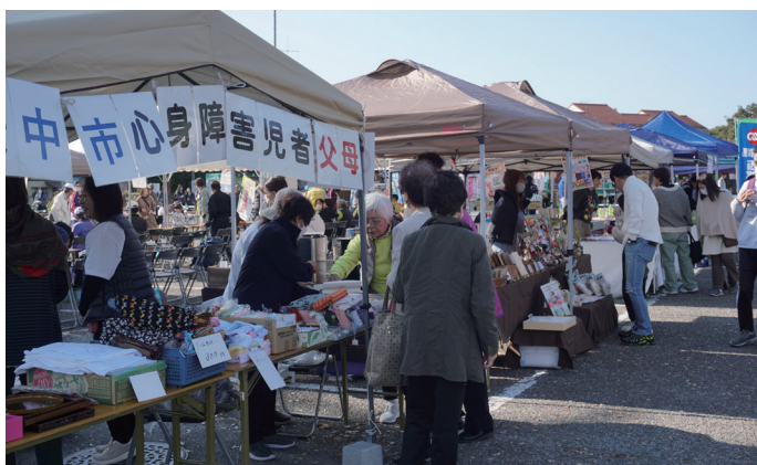
↑ 駐車場内イベント・模擬店

『福祉ふれあいまつり』は、この一日のふれあいを通して、多くの来場者の方々が社会福祉の大切さを感じる機会となりました。(和田)