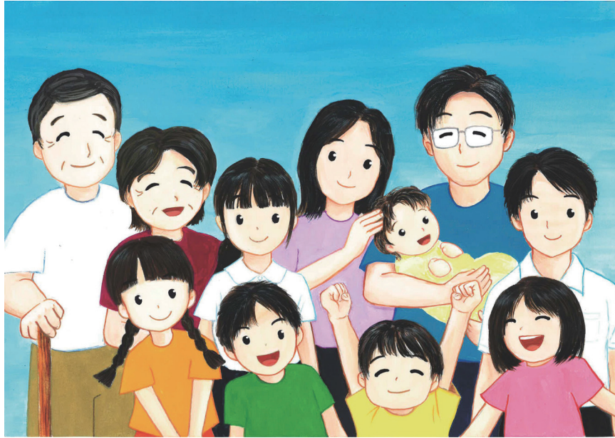
絵：安中市立松井田中学校美術部