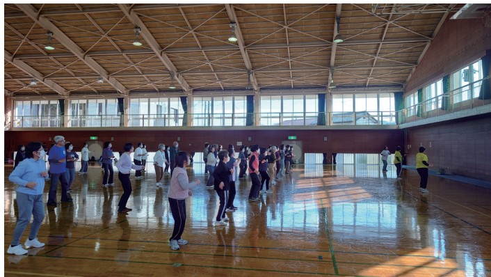
みんなで元気にズンバ！