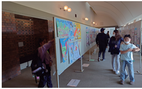
↑家族の絵、赤い羽根ポスター展示