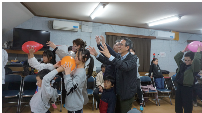
楽しく三世代交流！