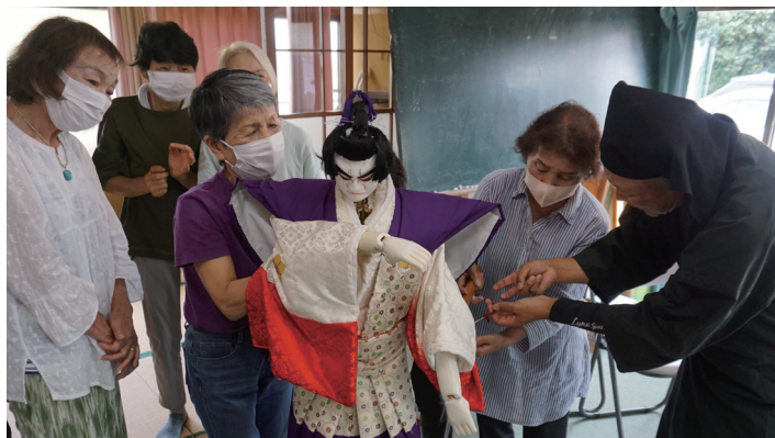
なかなかない貴重な体験！