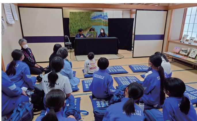
↑ 文化センター内読み聞かせコーナー