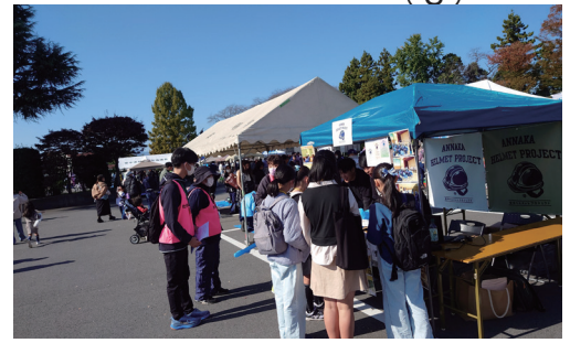
↑イベントブースの様子