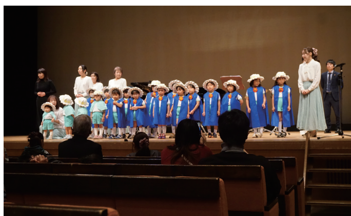
↑ 文化センターホールステージ発表