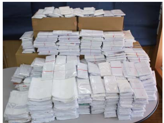
ご寄付いただいたタオル

今回は、平成20年12月から平成22年11月の間に寄付があった1,144本を、市内高齢者施設を中心に配布。受配先からは「ありがとうございます」「本当に助かります」と多くの感謝の言葉をいただきました。寄付していただいた皆様の善意に心から感謝を申し上げます。（事務局）