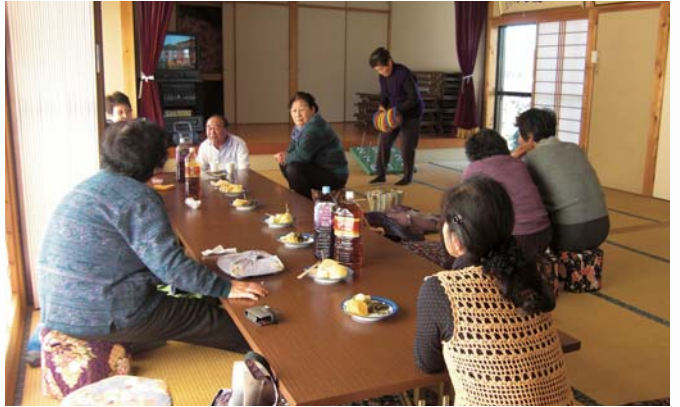
みんなと楽しい時間を過ごしています♪